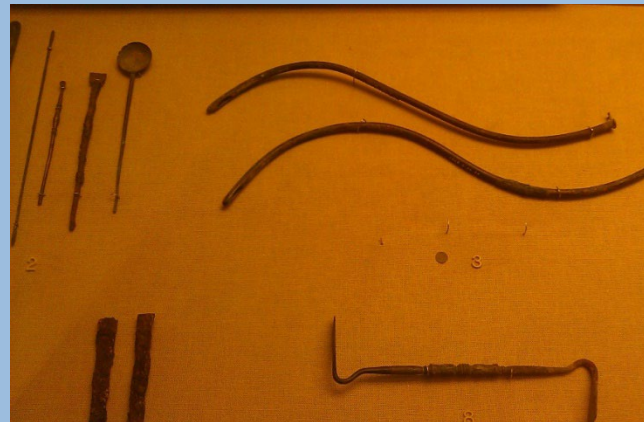
London, British Museum, Arztbesteck